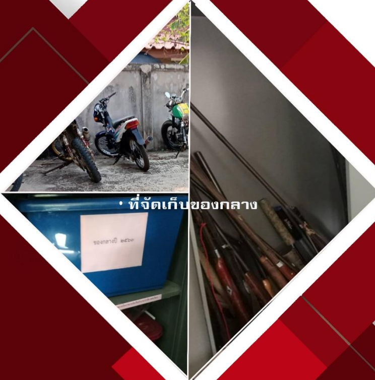
• ที่จัดเก็บของกลาง

การจัดเก็บของกลาง และแนวทางการนำไปปฏิบัติ ประจำปีงบประมาณ 2567